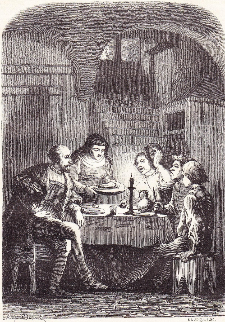
Charles-Quint chez le savetier.

en échangeant de joyeux propos avec ses commensaux. Le lendemain, il fit mander à la cour le savetier, et lui ayant offert une récompense à